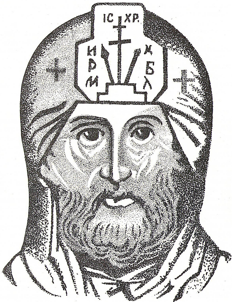
Рис. 3. Ефрем Новоторжский. С иконы XVII в.