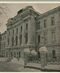
Здание бывшего Епархиального женского училища (ныне Детской областной клинической больницы)

С мая 1890 г. по ноябрь 1897 г. тверской губернатор, действительный статский советник и камергер. Происходил из старинного дворянского рода, окончил юридический факультет Московского университета со степенью кандидата права и поступил на канцелярскую должность в один из департаментов Правительствующего Сената. В 1887 году был назначен московским вице-губернатором. В Твери он особое внимание уделял вопросам правопорядка и законопослушания. Губернатор заменил половину руководства полиции отставными армейскими офицерами. Гонениям подвергались лидеры тверского земства. «Стремление навести порядок» привело к конфликту с дворянством. В годы правления Ахлестышева в Твери была образована первая губернская больница, на Волжской набережной открылось Епархиальное женское училище в составе двух классов, для нужд полиции появились первые телефонные аппараты, а 25 сентября 1895 года по улицам губернского центра проехал первый автомобиль.