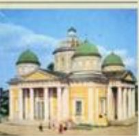
Христорождественский собор. Фотография 1980-х годов

С мая 1813 г. по август 1817 г. тверской губернатор в придворном звании камергера. Представитель старинного дворянского рода выходцев из Польши, одна из ветвей которого обосновалась затем в Тверской губернии. В период губернаторства в с. Каменском Новоторжского уезда (ныне Кувшиново) получила дальнейшее развитие первая в губернии бумажная фабрика. Пришлось изыскивать средства на восстановление внезапно разрушившегося соборного храма в Тверском Христорождественском монастыре. Позднее стал сенатором и членом Государственного совета.