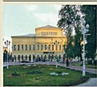
Здание Дома офицеров (бывшего Дворянского благородного собрания) на ул. Советской