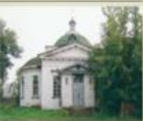
Троицкая больничная церковь Христорождественского монастыря выстроена в стиле ампира в 1830-1832 гг.

С 1 по 23 февраля 1831 г. тверской губернатор в чине действительного статского советника, после чего определен губернатором в Вильну. Происходил из эстляндской ветви шведского дворянского рода, получившего графское достоинство в начале XVIII в., владел именьями и в Тверской губернии.