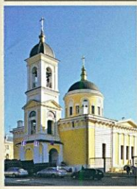
Вознесенский собор на Миллионной (ныне Советской) улице