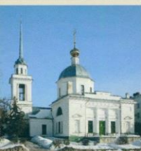
Церковь Мины, Виктора и Викентия в Затверчье

С мая 1804 г. по август 1812 г. тверской губернатор в чине действительного статского советника. В период губернаторства Ушакова в 1805 году в Твери были освящены две новые церкви: церковь Мины, Виктора и Викентия в Затверчье и надвратная церковь Спаса Нерукотворного Образа Тверского женского Христорождественского монастыря; началось мощение улиц камнем. В 1805 году открылся театр в Осташкове, а в 1810 году — курорт на Андреапольских минеральных водах, один из первых в России. Близ деревни Домкино нынешнего Конаковского района в 1809 году был основан фаянсовый завод, переведенный затем в селцо Кузнецово. Впоследствии здесь стали производить известный на всю Европу кузнецовский фарфор.