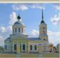
Церковь Георгия Победоносца в Юрьеве-Девичьем (1826-1830)